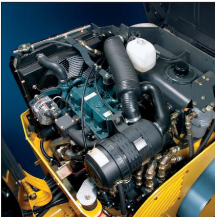
Facile assistenza: tutto facilmente accessibile.

Un altro vantaggio è costituito dai lunghi intervalli fra una sostituzione e l'altra, ad es. 2000 ore o 2 anni per l'olio idraulico e il filtro idraulico. Sotto questo aspetto la BOMAG ha raggiunto uno standard elevatissimo nella tecnologia di compattazione.