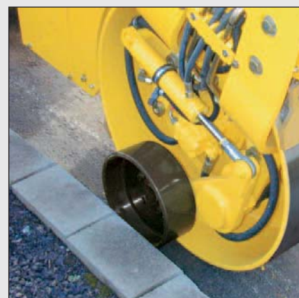
Opzione: tagliaasfalto; compattare fino ai bordi dei marciapiedi.