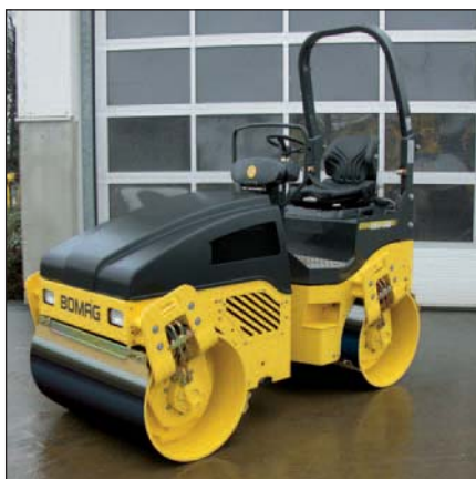
BW 125 AD-4 con un peso operativo di oltre 3 t.

vibranti tandem pesanti. Il comfort e l'ergonomia sono decisivi per l'efficienza dell'operatore. I comandi sono a perfetta portata di mano. Il visualizzatore multifunzione centralizzato fornisce all'operatore tutte le informazioni importanti.