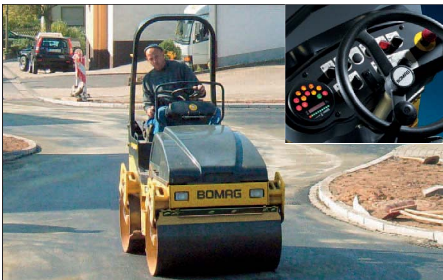
BW 120 AD-4: posto operatore isolato dalle vibrazioni; buona visibilità grazie al cofano motore e ai supporti inclinati.

I rulli combinati BW 100 AC-4, BW 120 AC-4 e BW 125 AC-4 sono veri esperti dell'asfalto. Uniscono l'elevato rendimento di compatta-