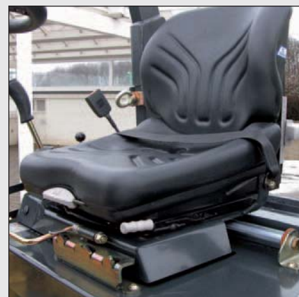
Opzione: sedile scorrevole lateralmente; disponibile anche con doppia leva di avanzamento.