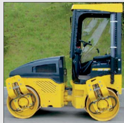
Opzione: cabina di protezione.

Gli operatori sono entusiasti della sua facilità d'uso sul cantiere. Il tagliaasfalto della BOMAG comprende tra l'altro anche un rullo di pressione conico. La sua caratteristica particolare è che grazie a questo dispositivo si può compattare fino al bordo di pareti senza che occorran altre macchine per lavori di ripassatura.