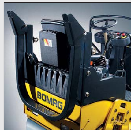
Opzione: ROPS pieghevole.