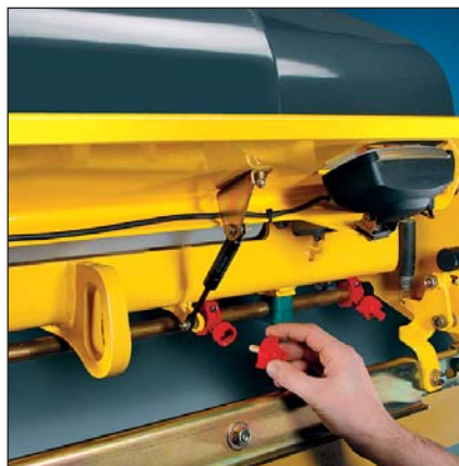
Particolari pratici: gli ugelli si trovano dietro una copertura al riparo dal vento e sono comunque facilmente accessibili.

La particolare costruzione del telaio dei rulli garantisce minime vibrazioni sulle mani e sulle braccia nonché una minima rumorosità.